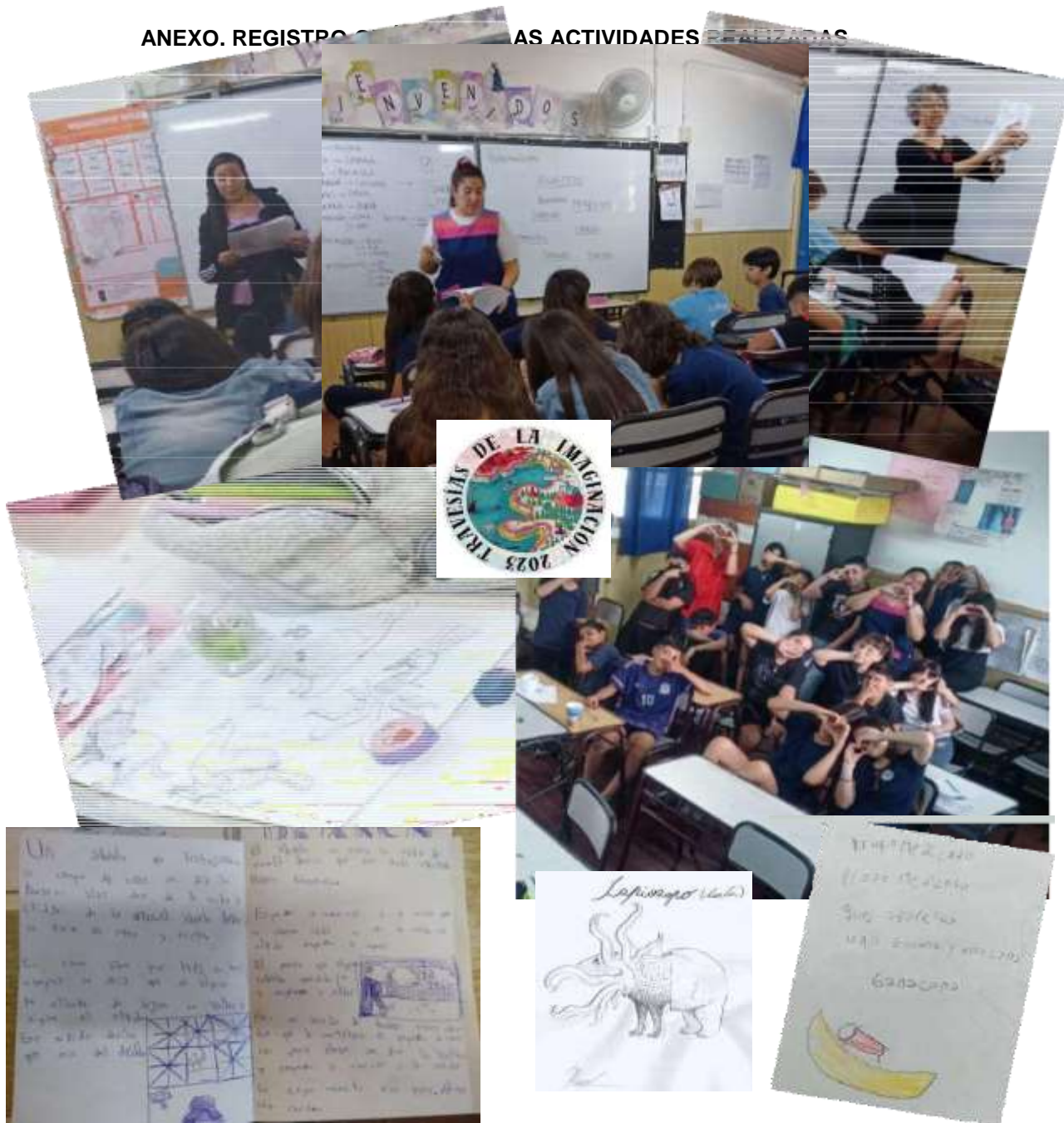
Taller "Travesías de la imaginación" 2023. Lectura de cuentos y caligramas, escritura de historias, acertijos, poemas dibujados, conjuros, juegos de palabras, invención de animales fantásticos (setiembre-diciembre 2023).