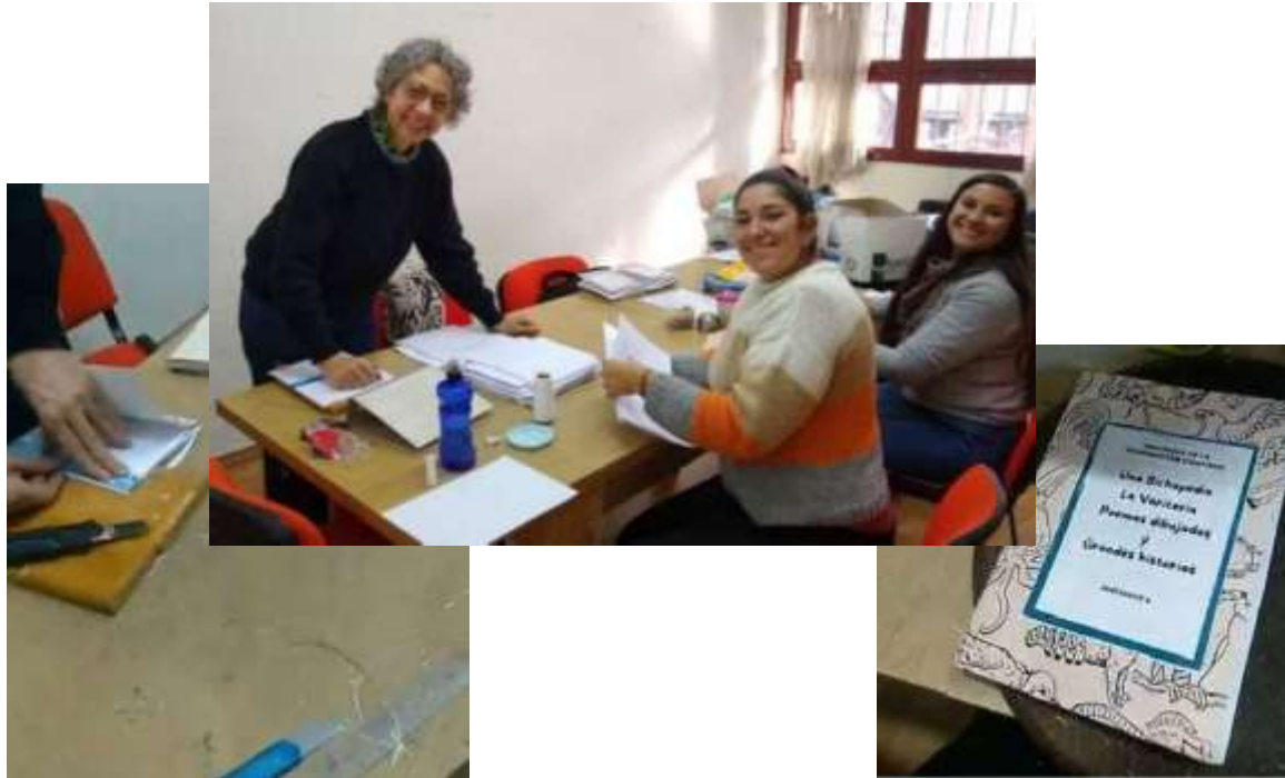
"Travesías de la imaginación" 2023. Encuadernación de libros artesanales. FEEd-sede centro, 28/6/24